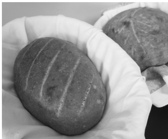
Dožínky - vzpomínkové vyprávění o svátku na konci žni, bylo velmi inspirativní...