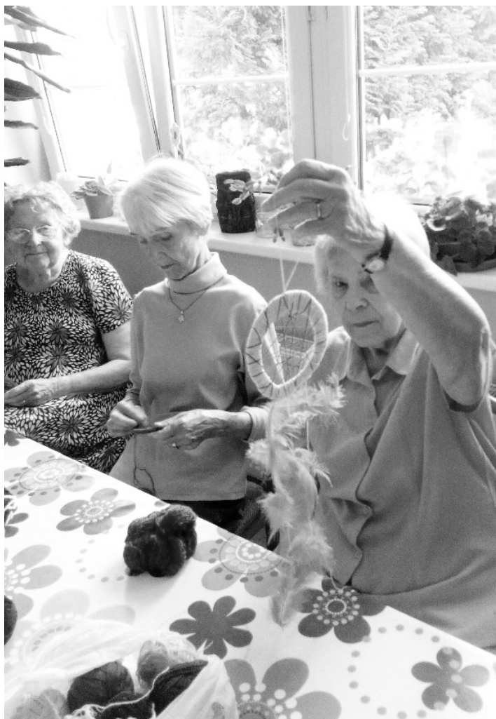
Někdo v létě chytá lelky, my zase sny...