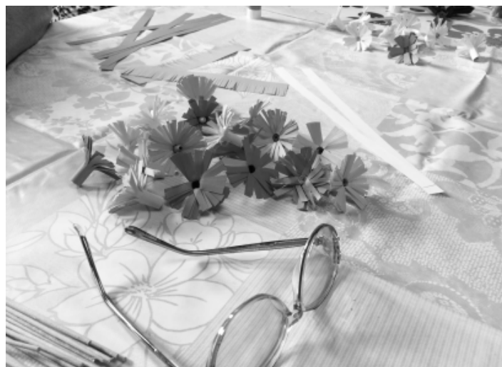
Léto nejen v kalendáři a za okny, ale i při aktivizaci...