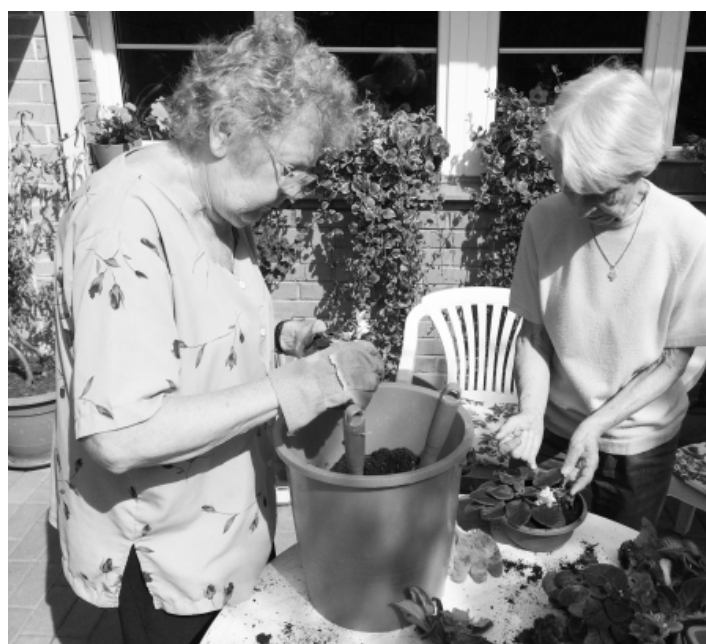
Pokojoyé květiny byly ze sluníčka již unavené...