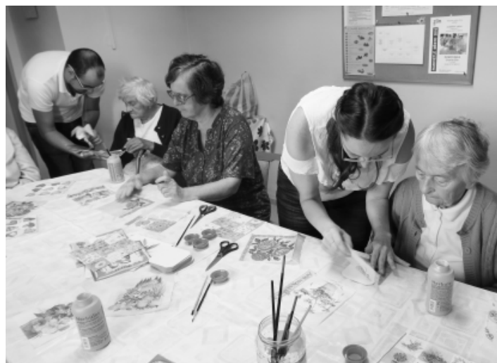
Decoupage domovinková: na podložce vlastnoručně vyrobené bude kávačka po obědě ještě více chutnat...