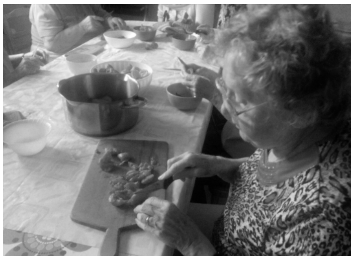
Marmeláda meruňková domovinková dobrůtková...