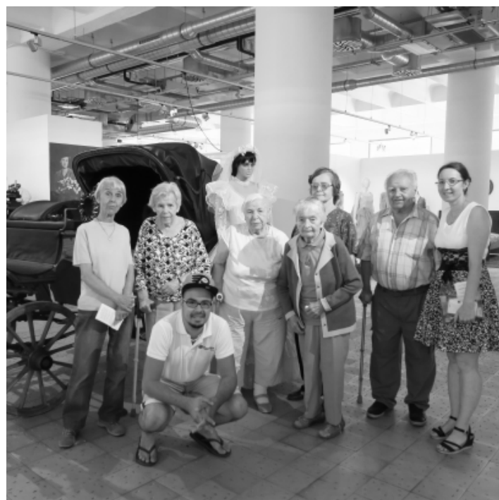
Navštívili jsme Zlínské nevěsty. Při prohlídce výstavy svatebních oděvů z let 1800-2000 došlo i na krátké zastavení nad fotografiemi: „Já jsem svoje svatební šaty musela prodat a za peníze jsem koupila látku na šaty pro běžné nošení,“ svěřila se jedna z užívatelů, jejíž svatební den byl na sklonku druhé světové války.