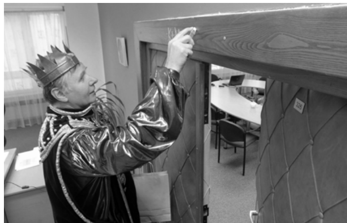
Byli jsme zde. Tři králové