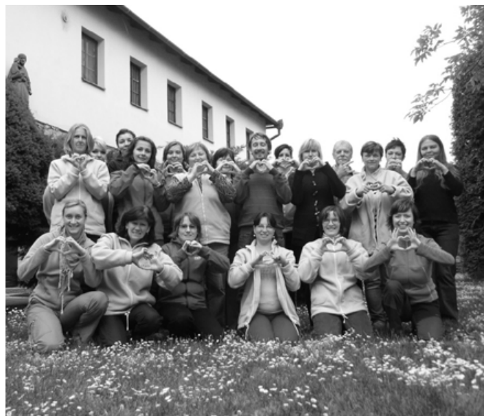
Pečovatelky a sociální pracovníce Střediska sv. Alžběty Připravila Eva Štefková

Alzheimerovou chorobou a je plně odkázána na pomoc jiné osoby. Ačkoliv by se mohlo zdát, že již nikoho nevnímá a svět se jí zúžil pouze na polohovací postel, v níž tráví celý svůj čas, není tomu tak. Kdykoliv spatří svoji dceru, rozzáří se jí oči a začne se usmívat. Tělo paní Marie sice vypovídá svoji službu, ale její duše je přítomná a vnímá vše, co se kolem děje. Máma a její dcera s rodinou žijí společně v jednom bytě. Pro babičku, jak ji láskyplně nazývá její dcera, je vyhrazena jedna místnost, kde se odehrává veškerá péče. Brzy ráno je třeba podat snídani a léky, poté přicházejí pracovníci charitní pečovatelské služby, aby ulehčili rodině s péčí. Je čas ranní hygieny. Vše se odehrává v klidném tempu na lůžku. Pracovníci si s paní povídají, i když jim nemůže odpovídat. Respektují intimitu, i když by leckdo řekl, že "už to vlastně není třeba". Pomáhají rodině zvládnout nelehkou péči, aby mohla jejich maminka a babička zůstat doma.