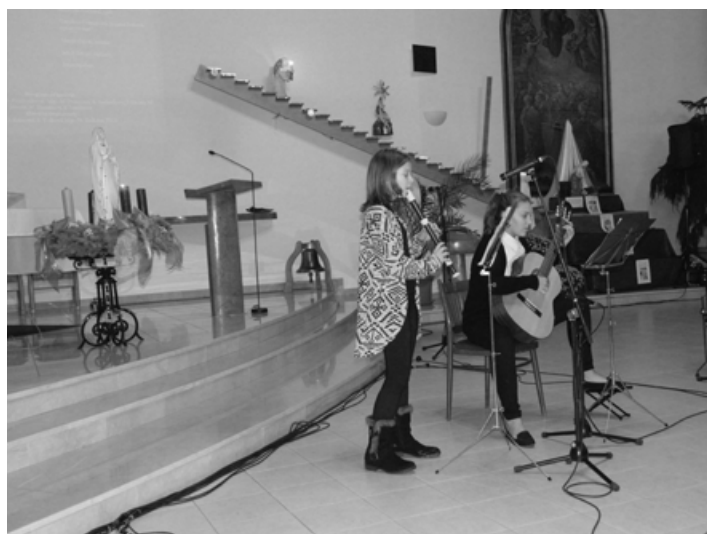
Hotel Vega s.r.o., Hydraulika Petráš, VAVRYS CZ, Vincentka a.s. a Zálesí a.s.