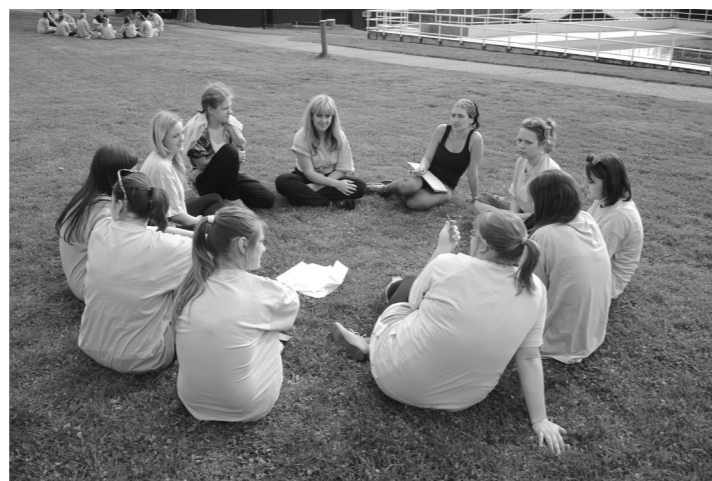
Své zkušenosti hodnotí formou závěrečné týmové reflexe s vyučujícími, kteří jejich výkon po celou dobu sledovali.