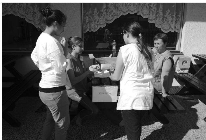
Kromě toho musí komunikovat i s organizacemi a učí se pracovat s místními zdroji pomoci.