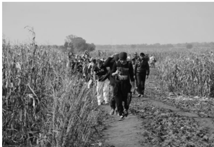
(monitorovací cesta Charity ČR na Balkáně)

„Co se týká situace, je potřeba ji vnímat jako měnící se v čase. Lidé, kteří vstupují dnes do Makedonie, v průběhu 20-40 hodin budou na chorvatsko-slovinské hranici a za dalších 10-15 hodin v Rakousku. Lidé nezůstávají na místě, ale putují za svým cílem, jímž je dosažení Německa. Pokud slovinská vláda omezí přístup uprchlíků na své území z 5-7 tis. denně na max. 2,5 tis. denně, má to za následek dominový efekt po celé délce uprchlické linie, kde potom dochází k další či nové potřebě humanitární asistence,“ přiblížil situaci humanitární pracovník Martin Zamazal z