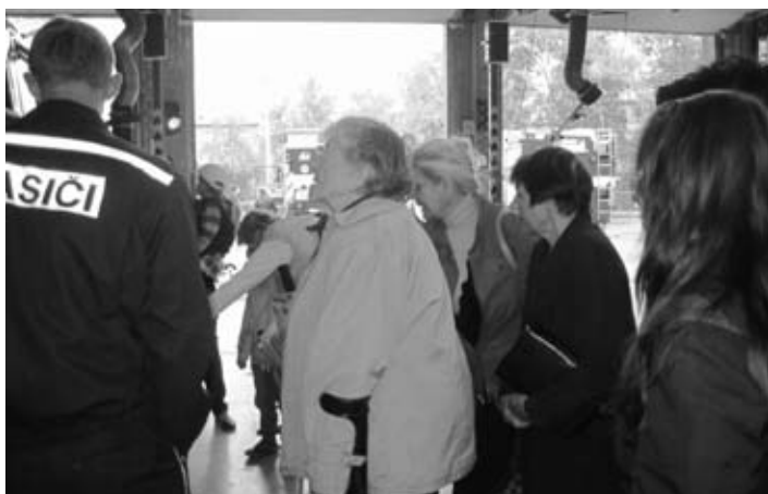
Otevřenými dveřmi jsme vstoupili mezi záchranáře

Poté následovala praktická ukázka odchytové techniky na hady a psy. Neopomněli jsme se zeptat, jestli zachraňují i jiná zvířata. Odpovědí byl příběh o záchraně kočky ze stromu.