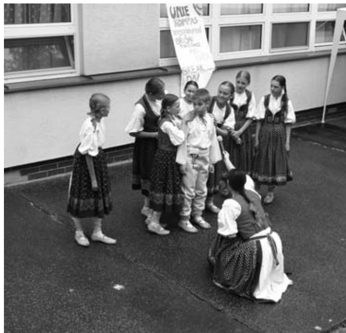
Valašský soubor Trnečka