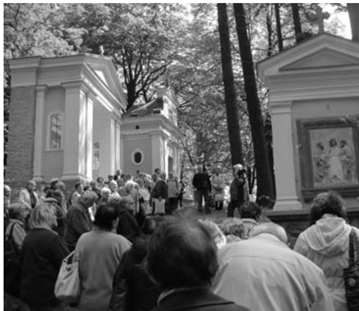
Křížová cesta na Svatém Hostýnu