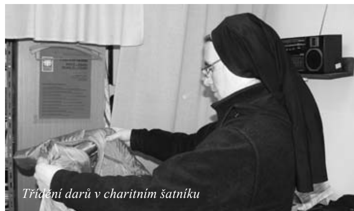
Třídění darů v charitním šatníku